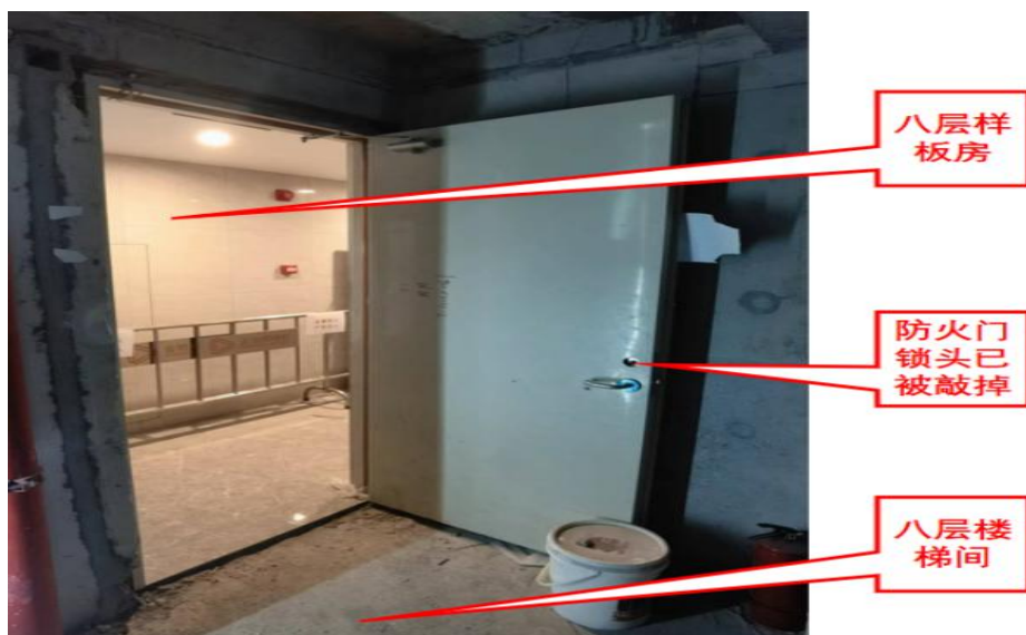
图 4 事发点八层楼梯间防火门勘查图