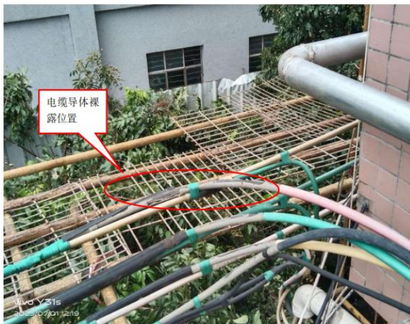
架空电缆线接头裸露处

3.现场勘查，涉事位置是电缆线从地下升到外墙与东西方向室外架空线接驳处，发现涉事位置东西方向电缆线接头施工方有用绝缘层再次进行保护处理，电缆线转弯处未进行再次绝缘层保护处理。