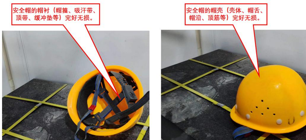
图 3 事发点莫灿森佩戴的安全帽勘查情况示意图

事发前，于 16 时 30 分许莫某森站在马凳上工作，经相关人员问询和施工单位项目经理指认，证实莫某森不慎从此处铁架上坠落，同时莫某森佩戴的安全帽从他头上脱落、向东北方向滚落 2 米左右静止。（见图 3）