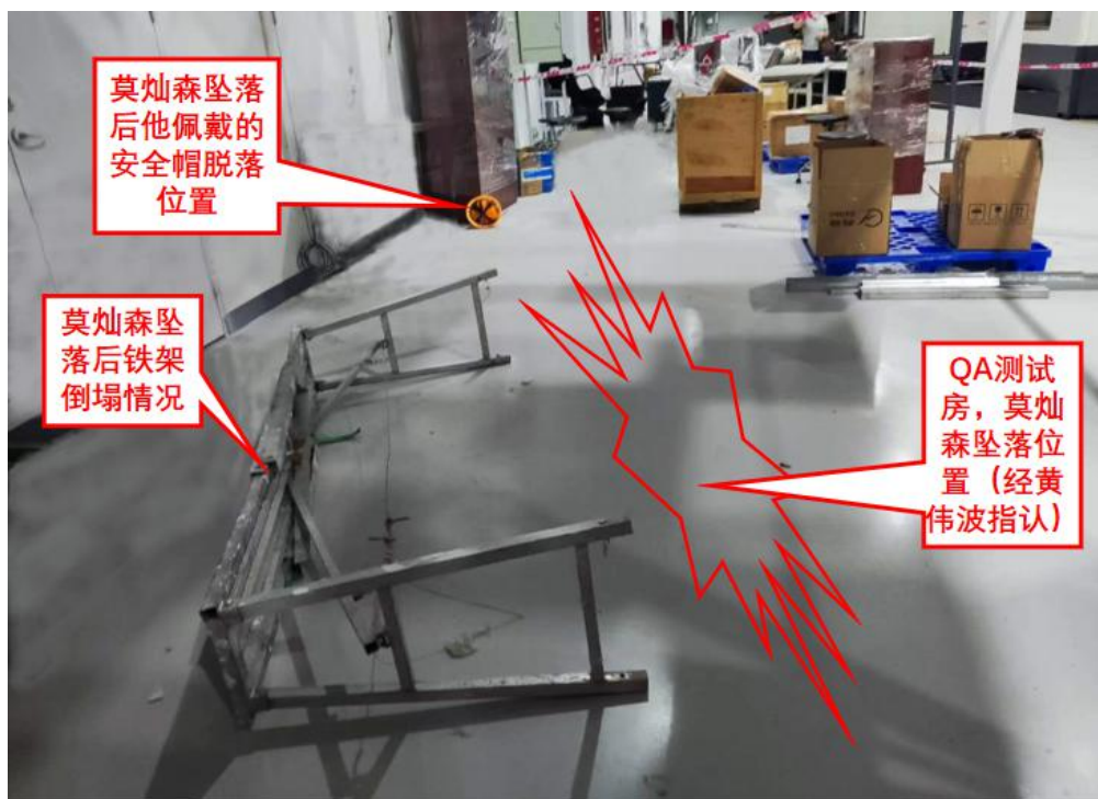
图 2 事发点现场勘查情况平面近景图