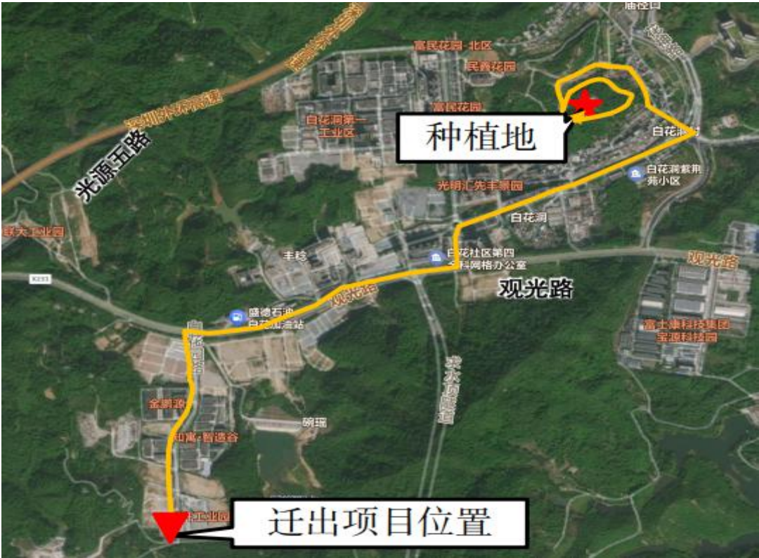
附件 2：迁移树木种植地点位置示意图